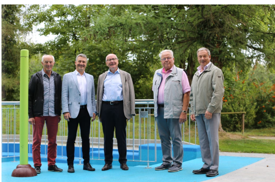
Freude bei der Präsentation der Wasserwelt: